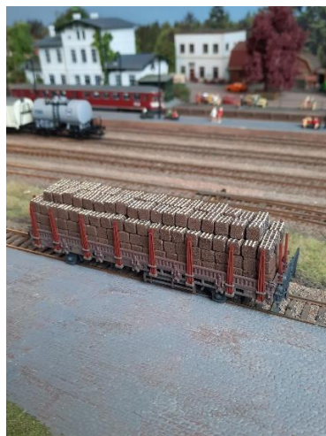
balen op de wagon