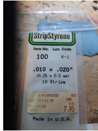
Figuur 3 styreen strip