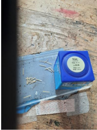
Figuur 1 beige verf met strips