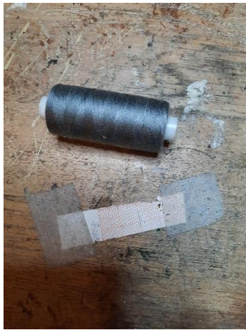
bindgaren en millimeterpapier