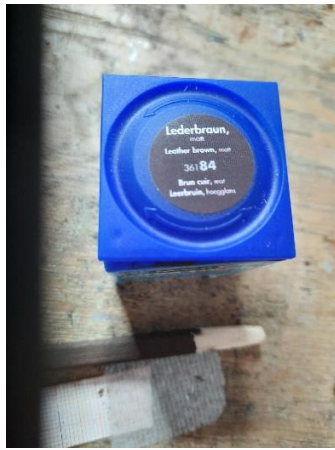
Figuur 2 bruine verf